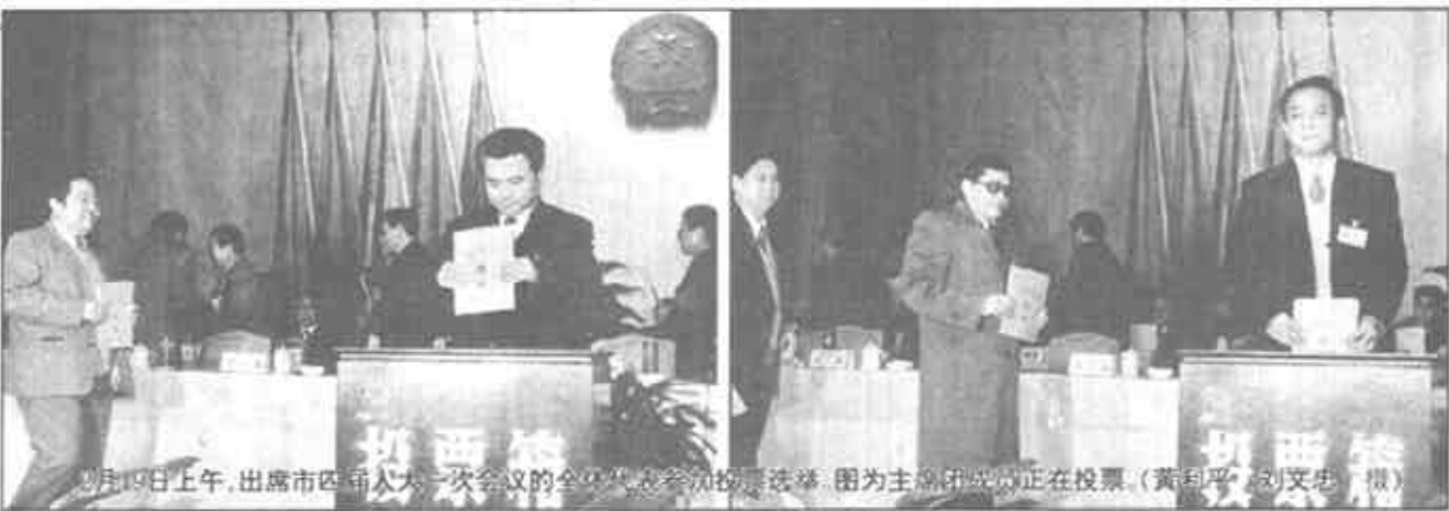
2月19日上午，出席市四届人大一次会议的全市人大代表正在投票。

理论是否联系实际，不仅是一个学风问题，而且是一个政治问题，关系我们事业的兴衰成败。早在延安整风时期，毛泽东同志就把理论和实践（下转第四版）